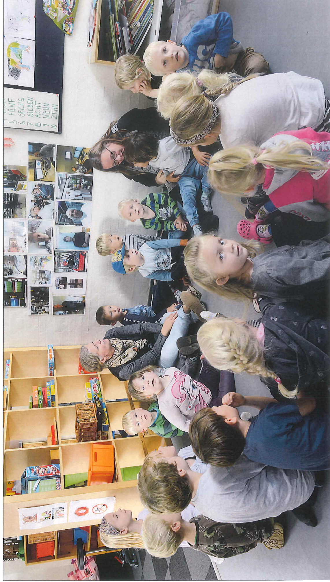
■ Personalet i storegruppe Blæksprutterne i den aldersintegrerede daginstitution Møllehusene var nødt til at laminere billederne af børnenes fædre for at gøre dem kyssefaste. I rundkredsen snakker børnene om, hvad far laver og finder sammenhængene mellem deres jobs.